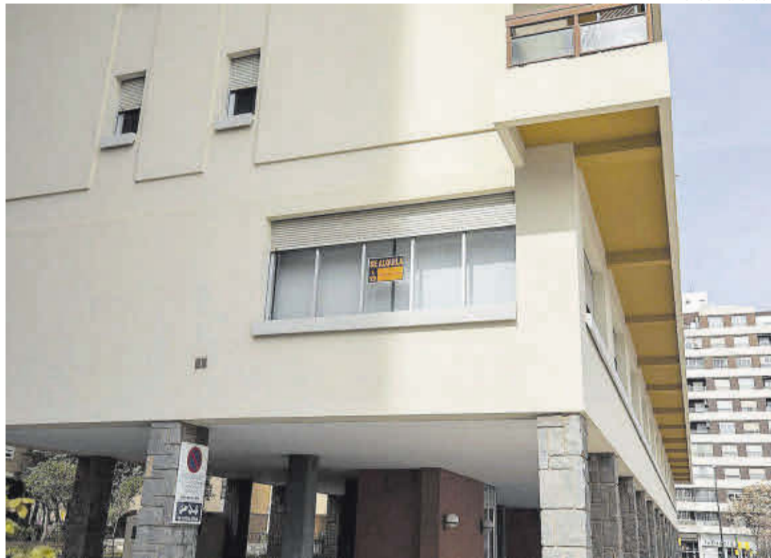
Nuevas reglas para el mercado. Vivienda con un cartel de alquiler en la zona de La Romareda de Zaragoza.

- Limitar el precio del alquiler en zonas donde es muy caro alquilar